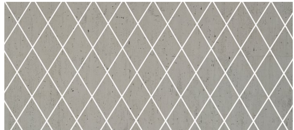
TL LINEA 104x62 Old Platin