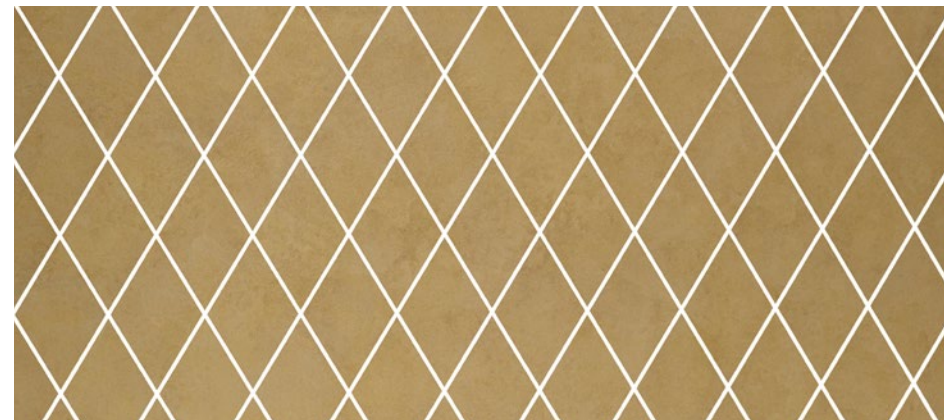
TL LINEA 104x62 Silent Gold